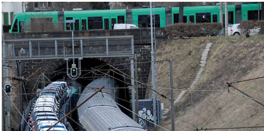
Der Schützenmatttunnel (RFC 2) muss auf P400 erweitert werden.

09:15 Mehr Güter auf die Schiene mit dem 4-Meter-Korridor, Thomas Staffebach, SBB Gesamtkoordinator Basel